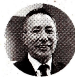
Ricardo Roa Presidente de Ecopetrol

“La tendencia de la compañía es al alza. Estamos alcanzando, en los primeros nueve meses, una producción de 752.000 barriles por día, que es la más alta registrada en los últimos nueve años”.