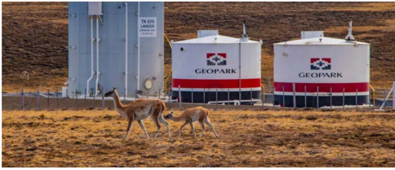
Así van los hallazgos de hidrocarburos de GeoPark y Hocol ( Ecopetrol ) en Colombia.