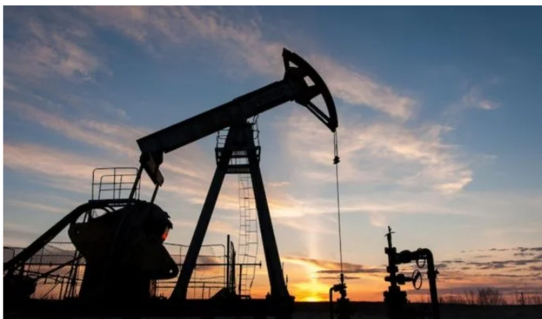
Así van los hallazgos de hidrocarburos de GeoPark y Hocol ( Ecopetrol ) en Colombia; inician producción.

Los hallazgos de hidrocarburos de GeoPark y Hocol ( Ecopetrol ) en Colombia avanzan a buen ritmo e, incluso, algunos de estos ya reportan inicio de producción.