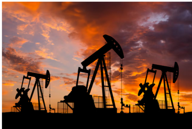
Con miras al 2025, las compañías tienen previsto seguir ampliando sus reservas y continuar su campaña exploratoria, con un enfoque claro en la seguridad energética del país.