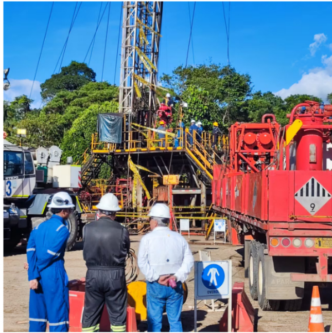
Los principales hitos en el desarrollo conjunto de estos bloques en la cuenca Llanos fue finalizada en el primer semestre del año de la adquisición de 653 km2 de sísmica 3D en los bloques Llanos 86 y Llanos 104, en el departamento del Meta.

Las dos compañías han presentado grandes logros, en particular el descubrimiento en la exploración del bloque Llanos 123, ubicado en el departamento del Meta, están asociados a los pozos Saltador-1, Toritos-1 y Bisbita. De acuerdo a la información suministrada por Ecopetrol , la compañía sigue avanzando en su delimitación de estructuras.