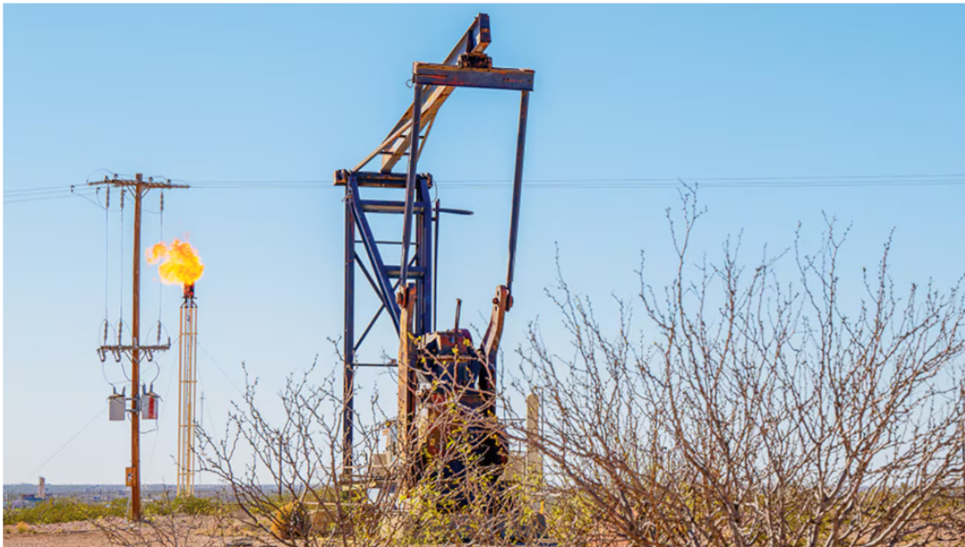
El compromiso de GeoPark y Hocol con la expansión de la producción y la incorporación de nuevos recursos es claro

12 de noviembre de 2024 Por: Redacción El País