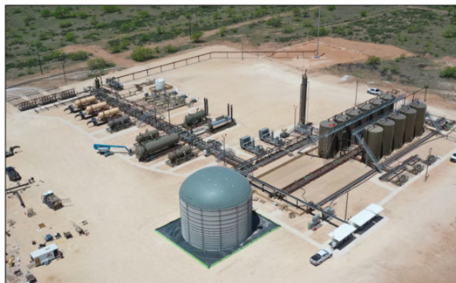
Las filiales de Ecopetrol , Geopark y Hocol, confirmaron hallazgos en la exploración y desarrollo de los bloques Llanos 86, Llanos 87, Llanos 104, Llanos 124 y Llanos 123 en la cuenca Llanos.

Geopark, compañía latinoamericana independiente líder en exploración y producción de petróleo y gas, en alianza con Hocol, filial del Grupo Ecopetrol . Han presentado hoy, 12 de noviembre del 2024, los importantes avances en el descubrimiento, exploración y el desarrollo de más de tres pozos de petróleo , principalmente ubicados en el departamento del Meta.