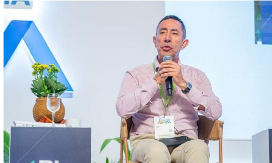
Ecopetrol producirá 800 toneladas de hidrógeno verde al año en Colombia.