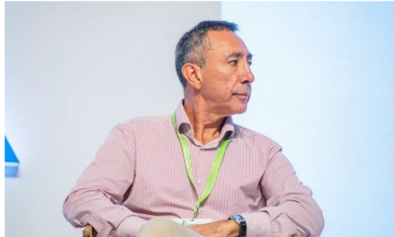
Ecopetrol anunció que hay suficiente gas natural en Colombia para 2025 y 2026.