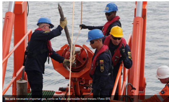
No será necesario importar gas, como se había planteado hace meses

Ecopetrol implementó medidas para bajar su consumo y se flexibilizó la regulación