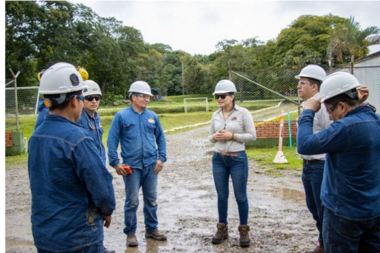
Fuente: Ecopetrol. A corte de septiembre, se destacó la vinculación de 25.471 empleos para poblaciones consideradas diversas: 20.749 mujeres, 2.093 de primer empleo, 1.719 de distintas etnias, 746 víctimas del conflicto armado y 164 en condición de discapacidad.

Entre enero y septiembre del 2024, el Grupo Ecopetrol generó 111.697 empleos acumulados a través de las empresas contratistas, subcontratistas y proveedores que apoyan sus proyectos y operaciones en diferentes regiones del país.