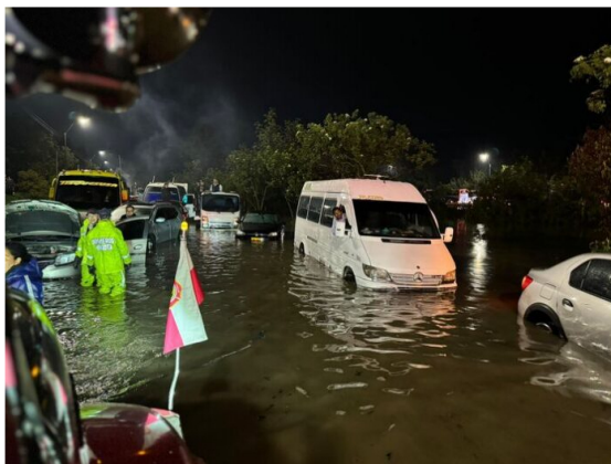
Fuente: AMB. Con el fin de actuar preventivamente, se sugiere a las instituciones educativas públicas y privadas ubicadas en la zona más afectada (entre las calles 200 y 225, y entre la autopista norte y la carrera séptima) considerar la reducción de la jornada escolar del día de hoy, jueves 07 de noviembre

Ante las lluvias atípicas ocurridas en las últimas horas, la Secretaría de Educación del Distrito reiteró su apoyo y acompañamiento a los colegios afectados por esta emergencia. Y se mantiene en articulación constante en el Puesto de Mando Unificado (PMU) con los organismos de atención de emergencias de la ciudad para responder a cualquier situación que impacte a la comunidad educativa.