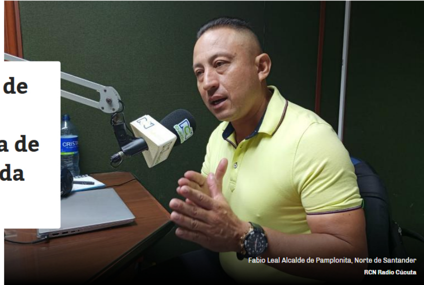
Fabio Leal Alcalde de Pamplonita, Norte de Santander