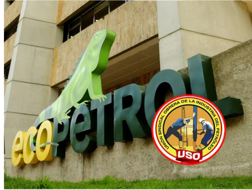
La Unión Sindical Obrera, hizo un llamado urgente a Ecopetrol.

En la JEP se conocieron testimonios sobre la participación de funcionarios en crímenes de lesa humanidad.