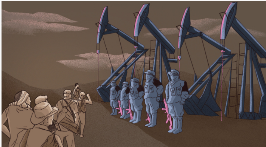
Ilustración: Kimberly Vega

El 28 de febrero de 1999, un grupo de las llamadas Autodefensas Campesinas de Santander y el Sur del Cesar (Ausac) entró a Barrancabermeja, en el Magdalena Medio colombiano, e hizo un recorrido por varios barrios del puerto petrolero. El resultado: ocho personas asesinadas y dos más que se llevaron para desaparecerlas.