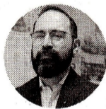
Andrés Camacho Ministro de Minas y Energía

El ministro de Minas dijo que a pesar del entorpecimiento judicial por la anulación de los nombramientos en la Creg , la entidad tiene los expertos necesarios para tomar las decisiones en materia regulatoria. “Hemos hecho una reflexión sobre la necesidad de transformar esa condición de la experticia en la Creg , actualmente los requisitos son muy exigentes, y es prácticamente imposible cumplir con los requisitos. Con las medidas que se han tomado jurídicamente, cada vez más se cierra el espacio para que se puedan cumplir los requisitos de la Comisión de Regulación de Energía y Gas ”, explicó Andrés Camacho .