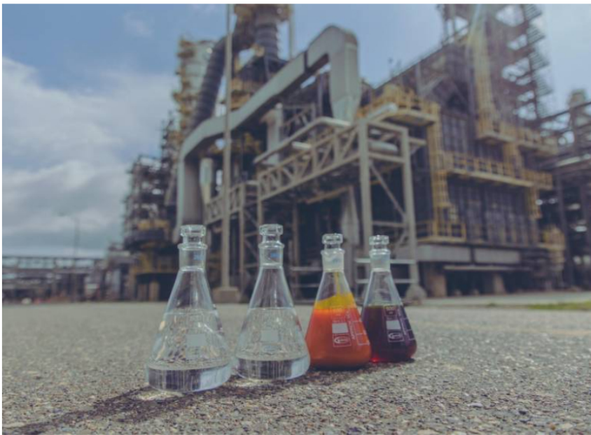
Se obtuvieron 32 mil barriles de combustible jet que incorporaron aceite de palma y aceite usado de cocina.

Ecopetrol concluyó una prueba de producción de combustible sostenible para aviones en Cartagena, obteniendo 32 mil barriles de SAF con aceites reciclados.