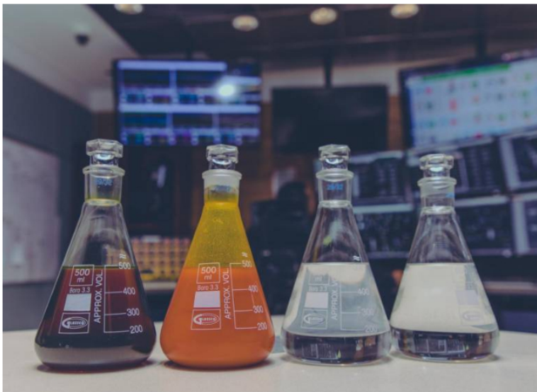
Ecopetrol se preparará para una producción sostenida en el año 2028, que requerirá previamente la expedición de la regulación nacional, el trámite de las certificaciones de ciclo de vida de las materias primas y del proceso productivo.

Le puede interesar: Estas son las lecciones aprendidas, luego de la crisis de abastecimiento de combustible para aviación en Colombia