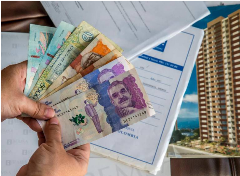
Según los expertos, es momento para que, si usted ha cumplido con sus obligaciones, le solicite a su entidad revisar las tasas de sus créditos.

Coopcentral con 20,87% E.A., Banco Pichincha 21,99% E.A. y Banco Agrario 23,13% E.A., son las tres entidades con las tasas de interés más bajas para tarjeta de crédito.