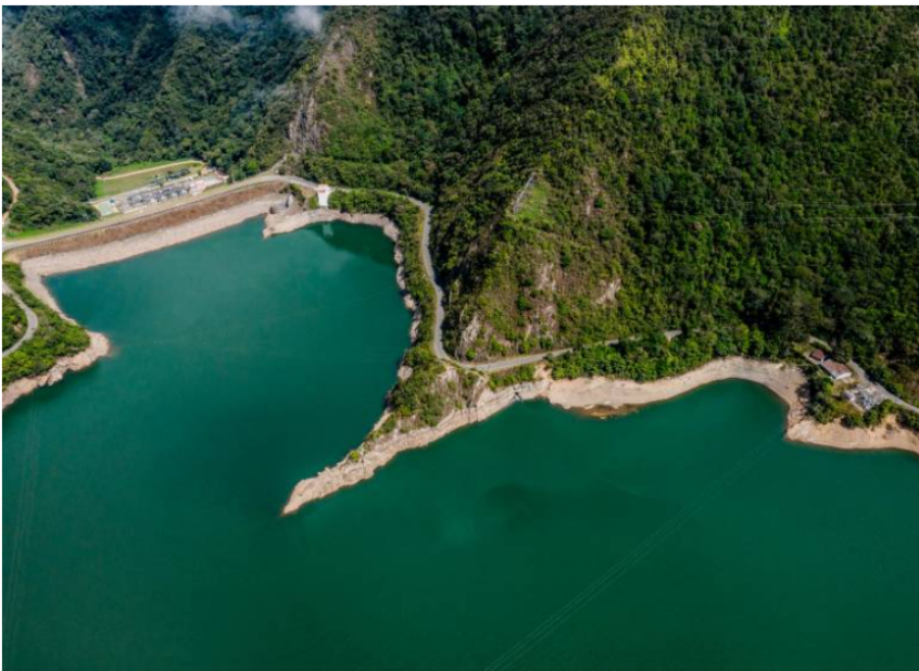
Central Calima uno de los embalses de Celsia en el Suroccidente colombiano. FOTO

La empresa avanza en su programa de readquisición de acciones.