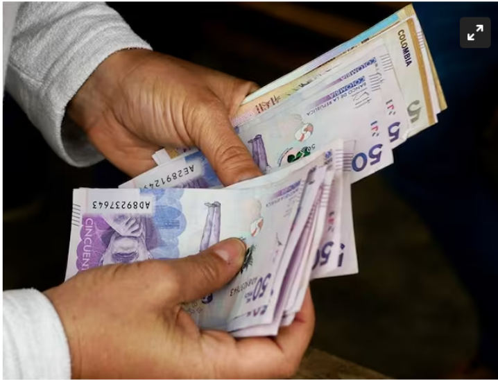
El exvicepresidente propuso eliminar las primas legales de junio y diciembre y suspender el pago de cesantías en su columna de opinión.

La ley da la fecha exacta de cuándo las empresas deben dar esta cantidad de dinero.