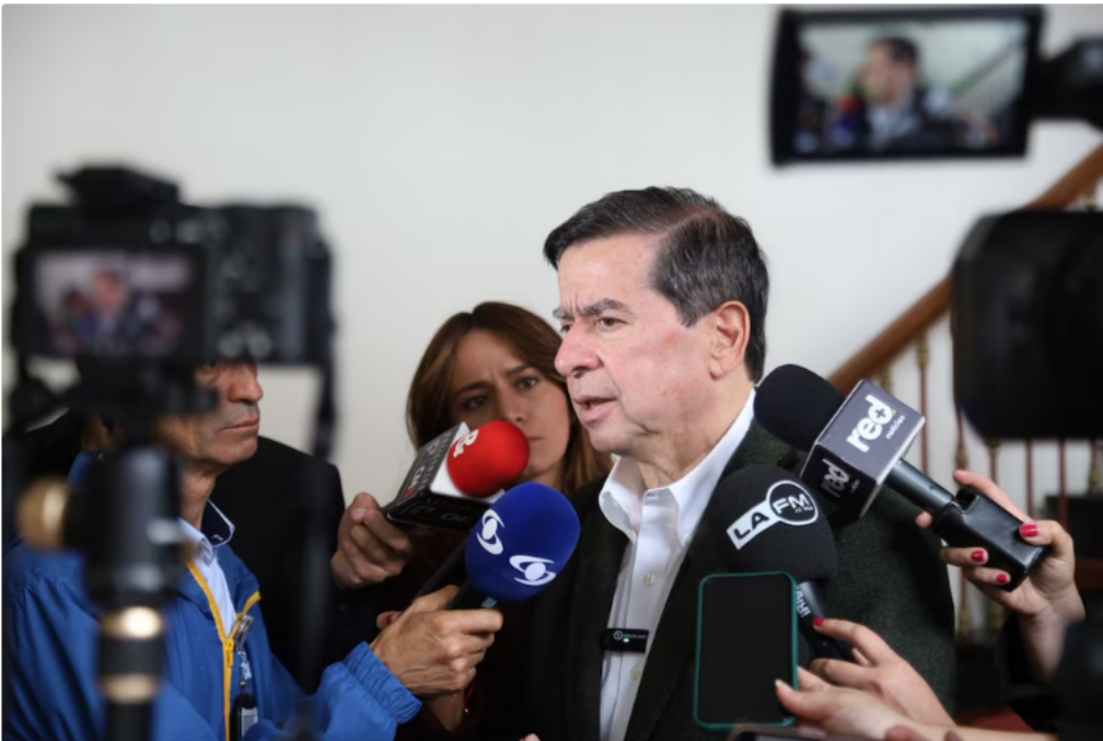
Juan Fernando Cristo, ministro del Interior en el Gobierno del presidente Gustavo Petro - crédito Ministerio del Interior.

“Creo que hay unas decisiones equivocadas del Consejo Nacional Electoral que generan esa sensación, espero que poco a poco, en la medida en que se vayan utilizando los mecanismos jurídicos para tumbar las decisiones equivocadas, la institucionalidad se va a ir deshaciendo de esos temores ”, comentó el ministro del Interior al citado medio de comunicación.