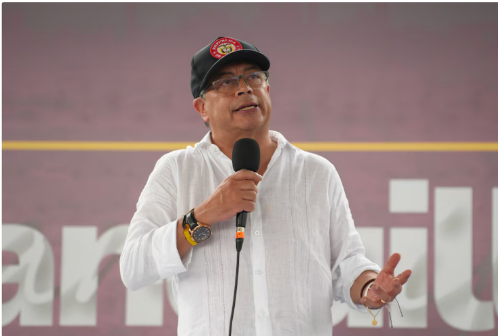
El presidente Gustavo Petro ha insistido en que se estaría concretando un plan que derive en su salida de la Casa de Nariño

Ahora puede seguirnos en Facebook y en nuestro WhatsApp Channel .