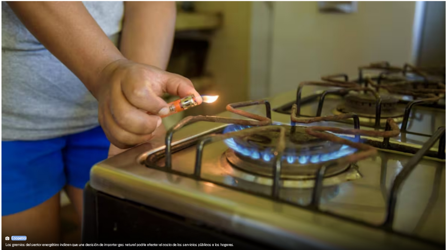
Los gremios del sector energético indican que una decisión de importar gas natural podría afectar el costo de los servicios públicos a los hogares.