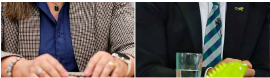
La fiscal general Luz Adriana Camargo y el presidente de Ecopetrol, Ricardo Roa.