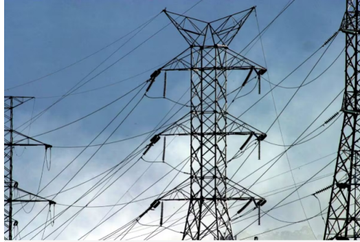
Utilidad de ISA crece un 10 % en lo que va de este 2024.

En el acumulado a septiembre, la empresa muestra solidez en sus operaciones y unas cifras financieras ascendentes: la utilidad neta alcanzó los COP 2,2 billones y el ebitda tuvo un incremento del 7 % frente al mismo periodo de 2023.