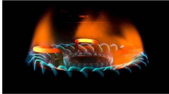
Presidente de la ANH asegura que déficit de gas está superado gracias a compromiso de Ecopetrol y nuevas disponibilidades en Piedemonte y Arrecife.

Publicado: Viernes, Noviembre 1, 2024 - 17:19 | Actualizado: Viernes, Noviembre 1, 2024 - 17:20