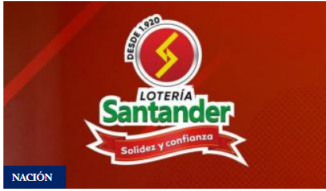
NACIÓN Lotería de Santander: resultados y premios del 1 de noviembre