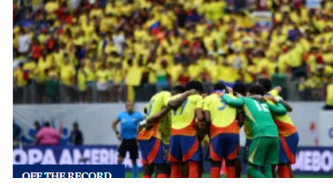
OPERA ALMERIA OBTUVO RECORD