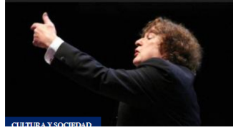
CULTURA Y SOCIEDAD