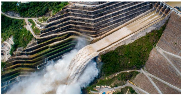
Colombia diseñó hace 30 años un sistema de gestión de energía con el que puede sacar pecho y visto en retrospectiva es uno de los más grandes tesoros del país.