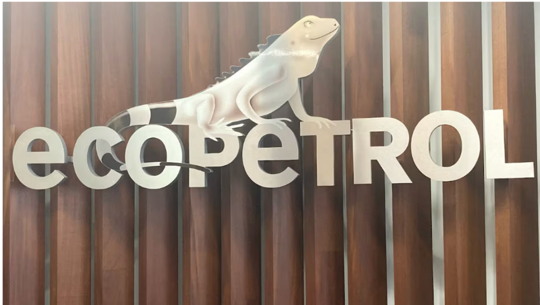
Logo Ecopetrol

31 de octubre de 2024 Por: Redacción El País