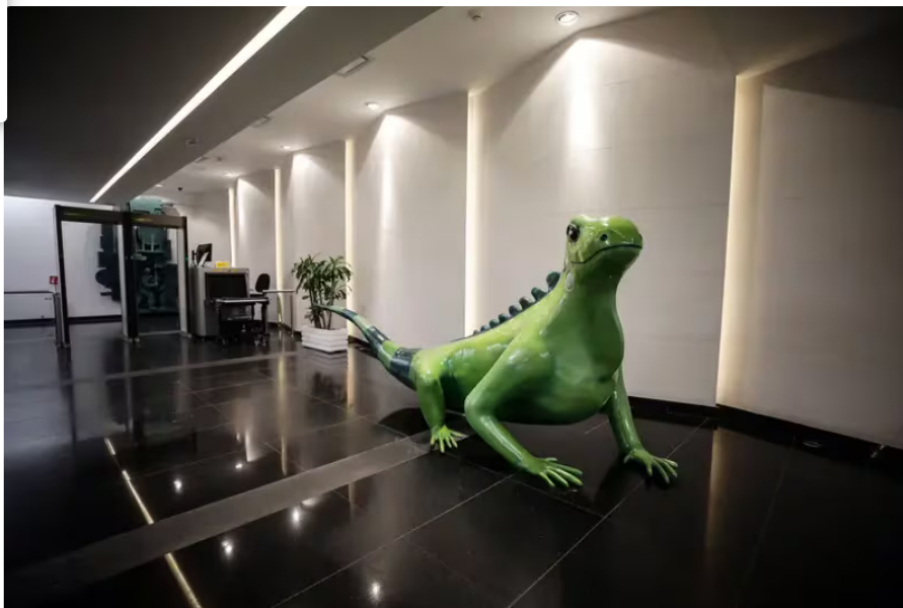
Ecopetrol Ecopetrol lucha contra el robo de petróleo con pérdidas cercanas a US$1.000 millones

Ecopetrol dijo que había unido fuerzas con el Ejército Nacional y la Policía de Colombia para combatir los ataques contra la infraestructura petrolera del país