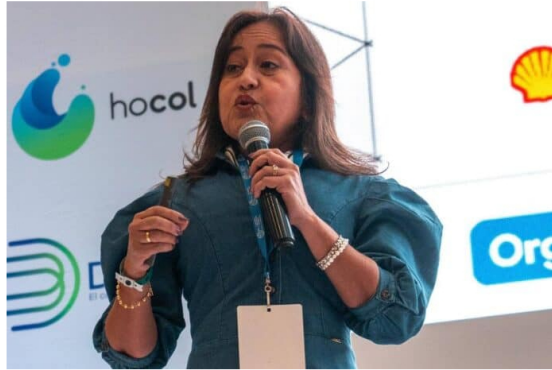
A finales de 2024, se determinará rentabilidad de pozos Orca de Ecopetrol.

Como se sabe, en diciembre de 2014, Ecopetrol anunció el primer hallazgo de hidrocarburos (gas Natural) en aguas profundas en el mar Caribe colombiano: en el pozo Orca-1 , localizado a 40 kilómetros al norte de la costa de La Guajira en Colombia.