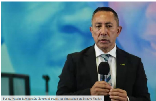
Por no brindar información, Ecopetrol podría ser demandada en Estados Unidos

¿De qué estamos hablando? El despacho de abogados estadounidense Bronstein, Gerwitz & Grossman LLC analiza demandar a Ecopetrol por violar las leyes federales de valores. Estos, entre otras cosas, garantizan que los inversores tengan acceso a información precisa sobre una empresa que cotiza en bolsa.