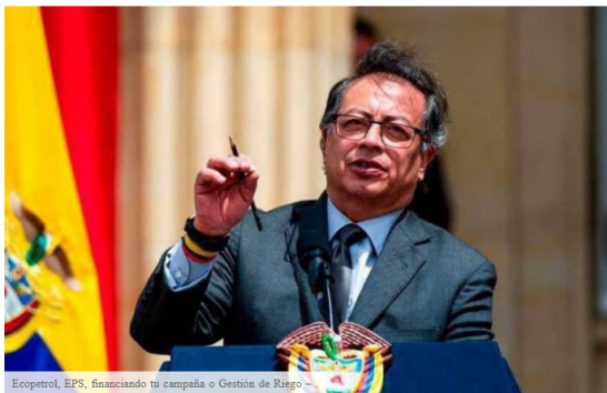
Ecopetrol, EPS, financiando tu campaña o Gestión de Riego –

Haga clic aquí para escuchar las noticias.