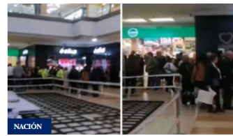
Mujer fue asesinada en Centro Comercial Santa Fe en Bogotá