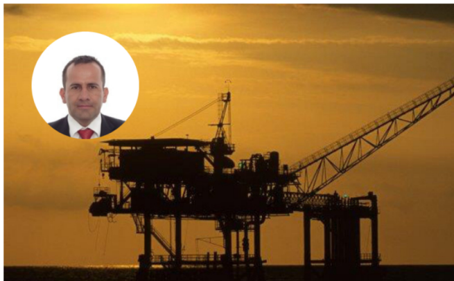
Este cambio se da en un contexto donde Ecopetrol buscan fortalecer sus operaciones y adaptarse a un mercado energético en evolución.