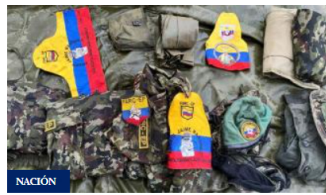
Tres heridos deja ofensiva militar contra disidencias Farc en Cauca