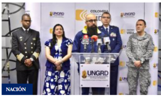
Temporada de huracanes inicia este primero de junio según Ungrd