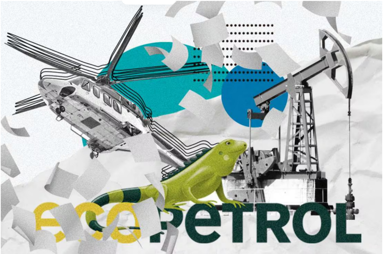
Imagen de referencia.