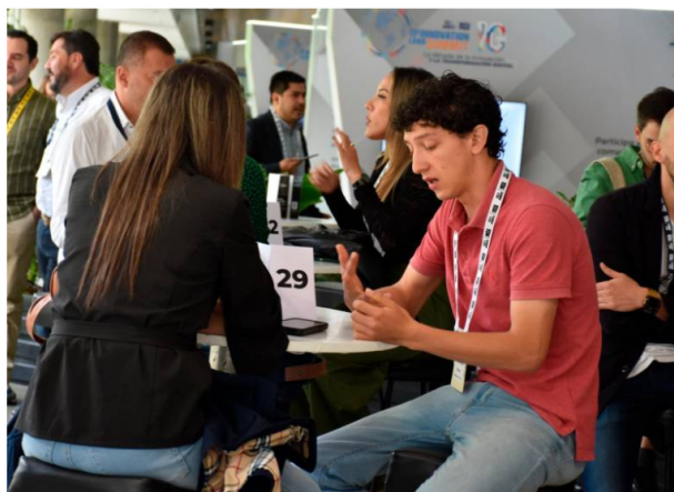
Rueda de negocios para emprendedores startups en el Innovation Live Summit, El sector privado aporta cerca del 60% de la financiación en investigación y desarrollo en Colombia.

Este miércoles comenzó el Innovation Live Summit, en Medellín, en ese evento, la Andi reveló que el sector privado aporta más recursos a ciencia y tecnología que las entidades públicas.