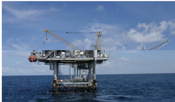
La petrolera tiene un portafolio prometedor con varios descubrimientos costa afuera que actualmente están bajo estudio para su desarrollo.

El gas costa afuera sería la mejor alternativa que tiene en este momento el país para aumentar sus reservas. Permisos ambientales y sociales, los retos.