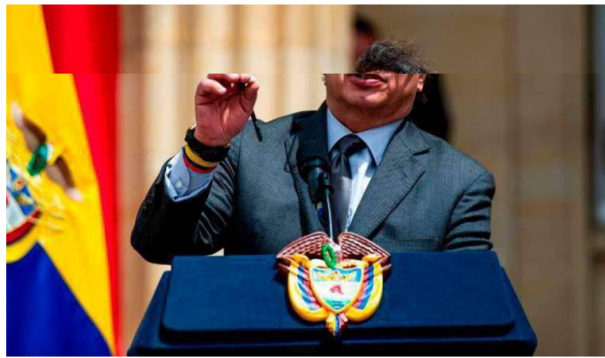
Presidente Gustavo Petro enfrenta crisis con la EPS Sura, UNGRD y Ecopetrol.

A semanas de que el jefe de Estado cumpla dos años de mandato, es decir, la mitad del "Gobierno del cambio", se siguen conociendo escándalos y cuestionamientos en el manejo del Estado.