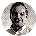
Ricardo Bonilla Ministro de Hacienda

ENERGÍA. EL MINISTERIO DE HACIENDA AÚN TIENE UNA CARTA BAJO LA MANGA QUE PODRÍA ABRIR UN NUEVO CAPÍTULO DEL DEBATE POR LAS REGALÍAS. SECTOR PRIVADO APLAUDE EL FALLO Y DICE QUE DA SEGURIDAD