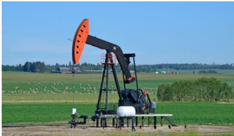
Producción de petróleo en Colombia subió levemente en primer trimestre de 2024.

Durante el primer trimestre de 2024, la producción de petróleo en Colombia fue de 773.900 miles de barriles promedio por día (KBPD), lo que representa una disminución de 1,1 % en comparación con el trimestre anterior (octubre, noviembre y diciembre de 2023), es decir, 8,84 KBPD menos.