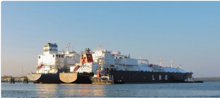
Buque metanero en spec

El Ministerio de Minas y Energía presentó a comentarios un proyecto de decreto con el que busca una serie de modificaciones al Decreto 1073 de 2015, con el objetivo de garantizar la seguridad energética del país y afrentar el déficit de gas natural proyectado para los próximos años . (Le puede interesar: Reservas de petróleo y gas: ¿son suficientes las medidas para revertir la caída? )