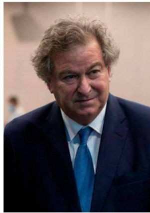
Dirk Van De Put (izq.), es el CEO de Mondelez Internacional, que estaría interesado en comprar parte de Nutresa, ahora de Jaime Gilinski (der.).