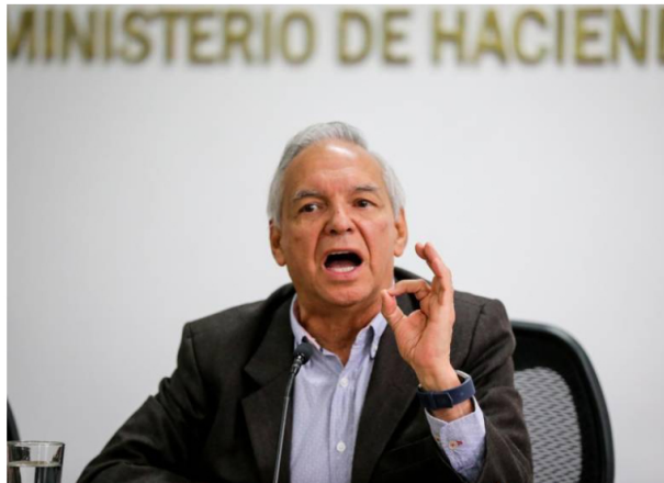
El ministro de Hacienda, Ricardo Bonilla, habla pedido a la Corte revisar su decisión.

El Gobierno perdió su oportunidad de reactivar la no deducibilidad de las regalías del sector extractivo.