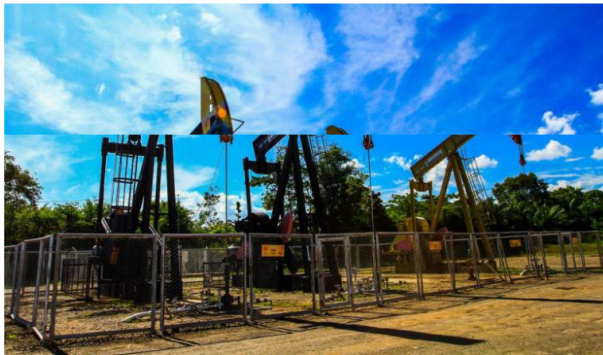
Para Campetrol, es crucial revertir la tendencia decreciente del PIB del sector de extracción y producción de petróleo y gas, que cayó un 2,3% entre el primer trimestre de 2024 y el último trimestre de 2023.

Tras segundo año consecutivo de caída en reservas de hidrocarburos, Campetrol alerta sobre la soberanía energética de Colombia