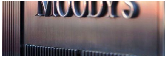
Moody's Investor Services