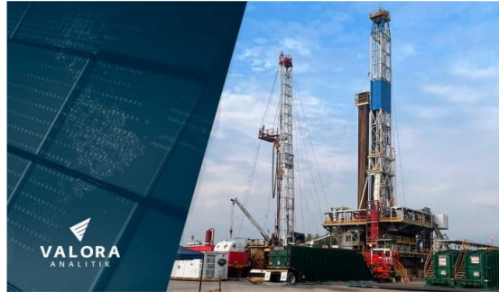
Ecopetrol revela estrategia para producir más petróleo y gas en proyectos actuales.

En línea con las decisiones tomadas al inicio del Gobierno del presidente de Colombia, Gustavo Petro, al menos por ahora, los proyectos de fracking en Colombia no van más, pero Ecopetrol trabaja en otras opciones con las que busca aumentar su producción y reservas de petróleo y gas . ¿Cuál es el plan?