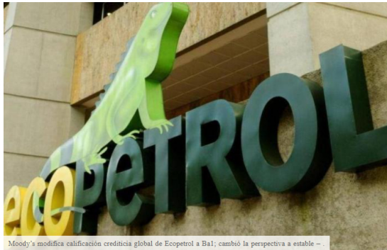
Moody's modifica calificación crediticia global de Ecopetrol a Ba1; cambió la perspectiva a estable - .

La agencia calificadoradora de riesgo Moody's redujo la calificación crediticia global de Ecopetrol, modificándola de Baa3 a Ba1 y cambió su perspectiva de negativa a estable.