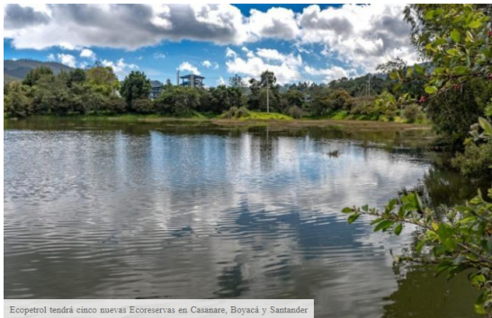
Ecopetrol tendrá cinco nuevas Ecoreservas en Casanare, Boyacá y Santander

El Grupo Ecopetrol anunció que destinará cinco nuevas áreas para Ecoreservas en los municipios de Piedecuesta (Santander), Tauramena y Aguazul (Casanare); y Puerto Boyacá y Páez (Boyacá), sumando un total de 498 hectáreas dedicadas a la conservación de la biodiversidad en estas regiones donde está presente.