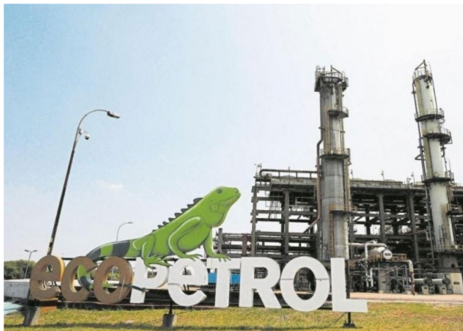
Este cambio ha ido de la mano con un plan de inversiones de capital que la empresa ha puesto en marcha para los próximos años.

La agencia calificadoradora ajusta su evaluación de riesgo crediticio, destacando la política financiera y la gestión de liquidez de la petrolera.