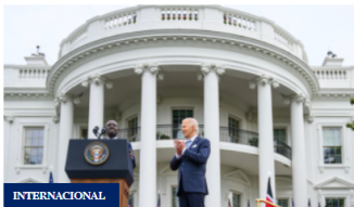
Acabar con pandillas de Haití promete en la Casa Blanca el presidente de Kenia