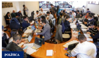
91 artículos aprobados del Plan de Desarrollo Distrital, ¿qué sigue?