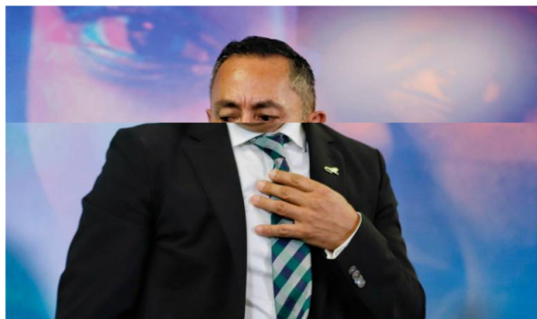
Ricardo Roa, presidente de la petrolera nacional, ha sido blanco de múltiples escándalos.

La calificadora argumentó que el nivel de endeudamiento de la petrolera creció, pero no pasó lo mismo con su ebitda.