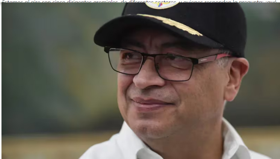
La Estrategia del Día: ¿Qué le quiere decir a Petro? Cinco dirigentes gremiales responden