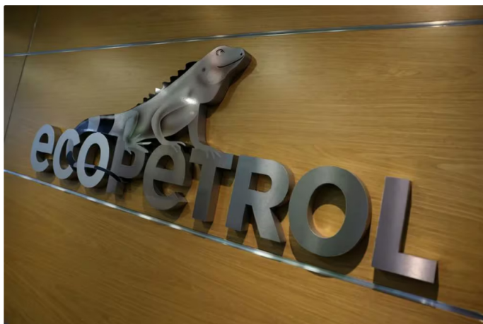
La Superintendencia de Industria y Comercio formuló pliego de cargos contra Ecopetrol, sus filiales y Helistar

La Superintendencia de Industria y Comercio (SIC) formuló un pliego de cargos a Ecopetrol, sus filiales Cenit y Ocesa, y a la empresa de transporte aéreo Helistar, por presunta participación en la elaboración de "pliegos sastré" para la contratación del servicio de transporte en la petrolera colombiana entre 2011 y 2023. Esta información fue difundida por varios medios de comunicación en los últimos días.