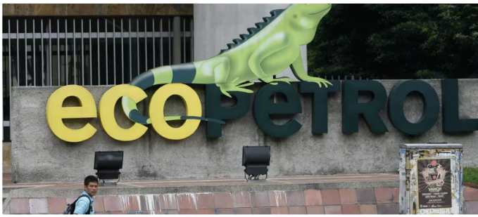
El rendimiento de los helicópteros debe evaluarse a una altura de 5.800 pies, mientras que la ciudad de operación está a 9.000 pies

Finalmente, pidió que los operadores cuenten con 1.200 horas de experiencia en los últimos 10 años en los equipos propuestos, un criterio que nuevamente solo Helistar cumple debido a su relación contractual previa con Ecopetrol. Este requisito podría influir decisivamente en la adjudicación del contrato, dejando sin oportunidades a las demás empresas participantes.