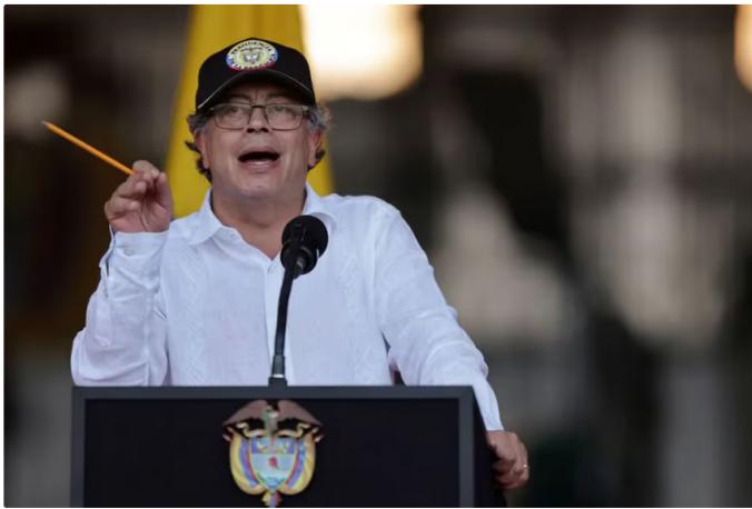
El presidente Petro afirmó: "Usaron a Ecopetrol como la caja del crimen y la política"

El presidente Gustavo Petro expresó su preocupación al respecto, criticando la posible cartelización en Ecopetrol y señalando que "usaron a Ecopetrol como la caja del crimen y la política" , según reportó la revista Cambio . Sin embargo, se sugiere que estas prácticas podrían continuar incluso bajo la actual administración gubernamental.