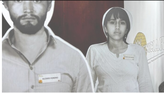
Se han recibido 1.706 solicitudes de familiares a través del formulario web y por correo electrónico, de las cuales 1.603 corresponden a víctimas incluidas en el Anexo I y 103 en el Anexo III de la sentencia, una gran parte por casos de ejecuciones extrajudiciales y desaparición forzada.

La Unidad para las Víctimas ha avanzado en el reconocimiento de las medidas indemnizatorias a las víctimas de la Unión Patriótica reconocidas en la sentencia de la Corte Interamericana de Derechos Humanos (IDH) en la que le ordena al Estado colombiano repararles.