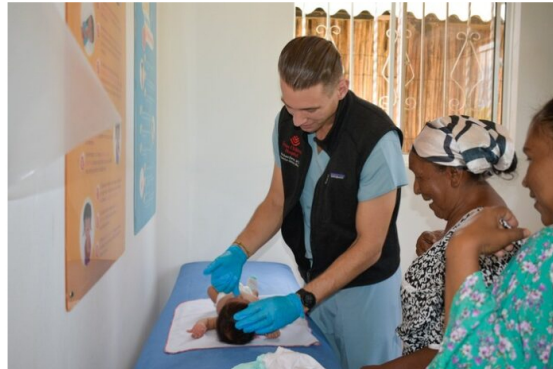
El proyecto tiene un enfoque integral, que incluye atención médica, educación comunitaria y asesoría en proyectos productivos, para beneficiar en los próximos dos años a más de 2.200 personas, adicionales a los 5.000 miembros de la comunidad Wayúu que ha atendido la iniciativa en salud.

El Grupo Ecopetrol, a través de sus filiales Ecopetrol USA y Hocol, y Texas Children's Global de Estados Unidos, invertirán alrededor de $900 millones de pesos (US$227mil) para apoyar el Programa de Salud y Autosuficiencia Indígena (SAIL) que desarrolla en el departamento de La Guajira la Fundación Baylor Colombia, afiliada a Texas Children's Global.