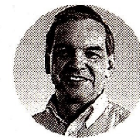
Ricardo Bonilla Ministro de Hacienda y Crédito Público

Según cálculos del Ministerio de Hacienda , la inversión extranjera directa diferente a petróleo y minería presentó un repunte de 79,7%. Según la entidad, el país registró ingresos de US$727 millones en abril de 2024, y alcanzó un indicador en el mismo lapso de US$1.598 millones, cifra que casi duplica a la de 2023, la cual fue de $889 millones. Sin embargo, según un análisis de Colombia Risk , "El deterioro de las perspectivas fiscales del Gobierno Nacional disminuirá la confianza de inversionistas interesados en Colombia, afectando la inversión extranjera directa y las oportunidades para empresas".