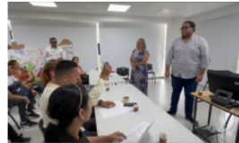
Docentes realizaron plantón exigiendo nombramientos en zona rural