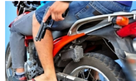
Actos sicariales y delincuenciales marcaron el fin de semana