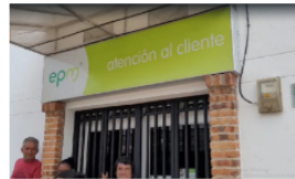
Protesta en Yondó contra EPM por altas tarifas de energía