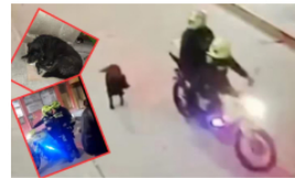
Agentes de Policía golpean perrita en plena vía pública