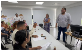
Secretaría de Educación presenta estadísticas a docentes en reunión de protesta