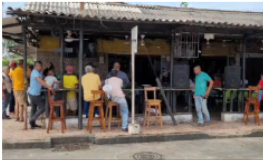
Protestan en Yondó contra EPM por mal servicio de energía