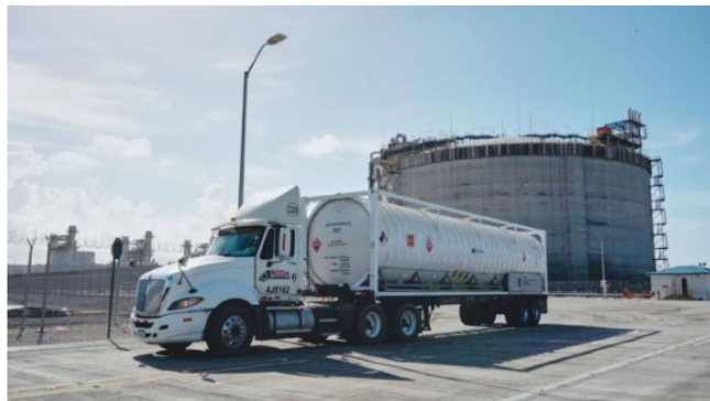
Durante los seis meses que dura esta prueba de concepto, se importarán 0,320 Gbtud de gas.

Como es conocido, en su última reunión con el presidente venezolano, Nicolás Maduro, el mandatario colombiano Gustavo Petro anunció la posibilidad de llegar a acuerdos en temas de energía, comerciales y de transporte que beneficiaría a los dos países.