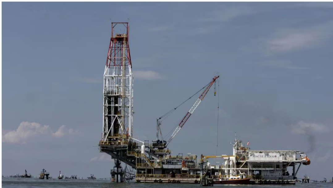
MARCAIBO, VENEZUELA - 2 DE ABRIL: Torres y plataformas petroleras pertenecientes a Petróleos de Venezuela, S.A., la compañía estatal de petróleo y gas, se observan cerca de la orilla del lago de Maracaibo. El 2 de abril de 2019 en Maracaibo, Venezuela.

20 de mayo de 2024 Por: Redacción El País