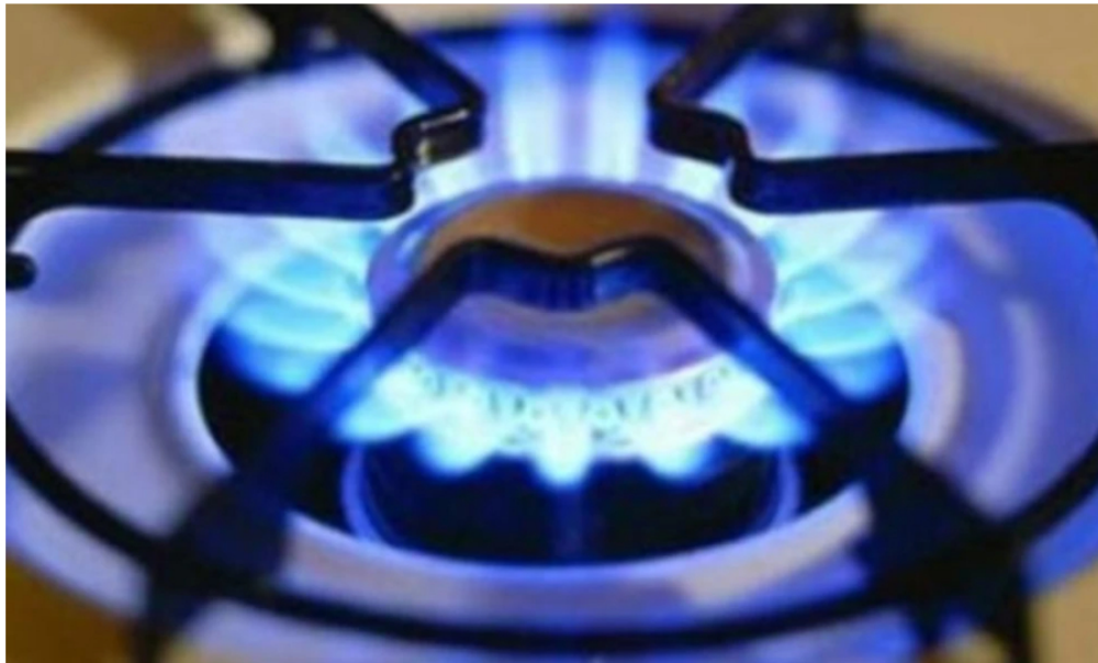
Gas natural

El Gobierno prepara nuevas reglas para evitar un faltante de gas natural en el país en 2026. El paquete incluye mayor flexibilidad para importar gas natural e incluso permite que las importaciones respalden el desarrollo del gas costa afuera.