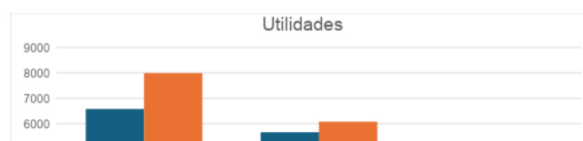
Cuadro 1. Utilidades de Ecopetrol en precios corrientes y constantes de 2024 (billones de pesos)

Nota: para el cálculo en precios constantes se toma el IPC de marzo a marzo, según datos del Dane y Ecopetrol.