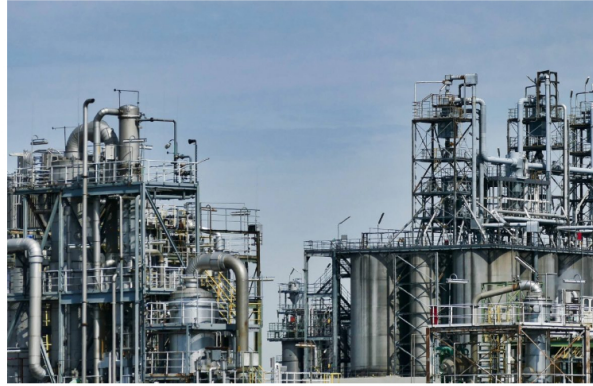
Foto: Refinería petroleo

La discusión ha sido acalorada y los rumores sobre Ecopetrol siguen circulando. Por eso es importante esta mirada muy fría a las cifras: la petrolera colombiana no va bien.