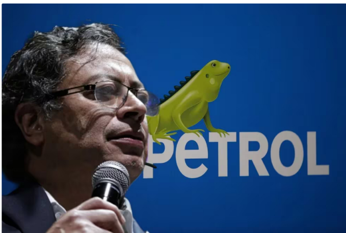
Gustavo Petro se refirió al escándalo que salpica a Ecopetrol, con presuntos pliegos sastré para favorecer a una sola firma en el transporte via helicóptero

La publicación de un artículo periodístico, en el que se mencionó lo que sería un presunto cartel de los helicópteros al interior de la Empresa Colombiana de Petróleos (Ecopetrol), cuyo desfaldo sería de los 500.000 millones de pesos, generó una fuerte controversia en las redes sociales. Y, como era de esperarse, una dura reacción del presidente de la República, Gustavo Petro, que se pronunció el domingo 19 de mayo