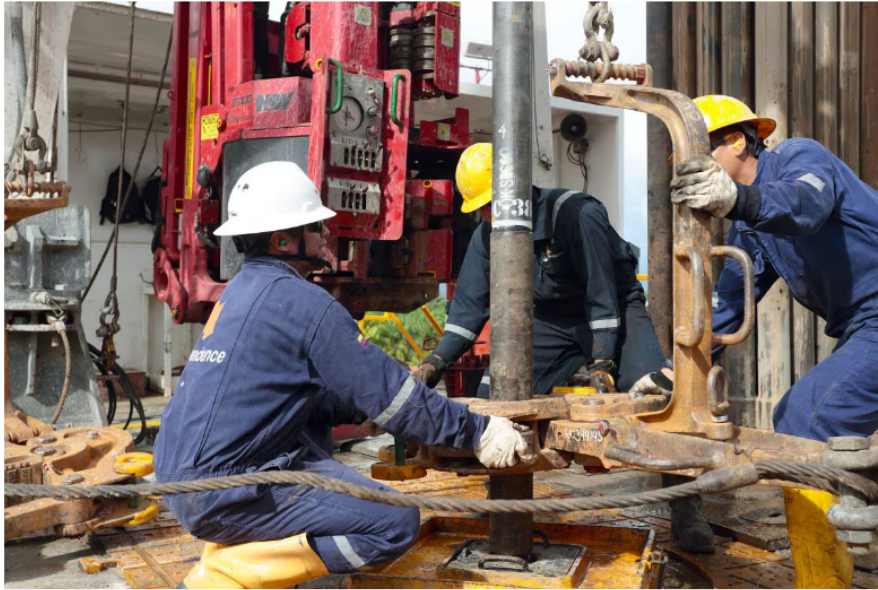
Ecopetrol prioriza las firmas locales como una fuente que promueve la reactivación económica en las regiones.

audio donde celebran el asesinato de Hernán Franco, en la 93. "Bendito Dios"