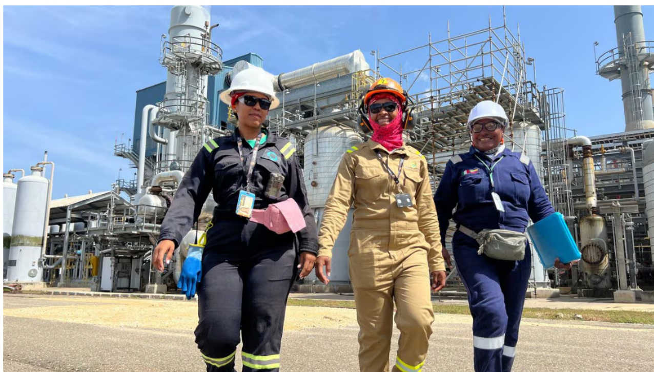
En los municipios en los que adelanta operaciones se contrataron bienes y servicios por más de 5 billones de pesos.

Ecopetrol , la empresa más grande de Colombia, no solo es una fuente crucial de ingresos, sino también un motor de empleo y actividad económica en las regiones del país. El año pasado, Ecopetrol destinó más de 23 billones de pesos a la contratación de bienes y servicios.