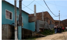
Autoridades investigan homicidio en Brisas de La Paz en Barrancabermeja