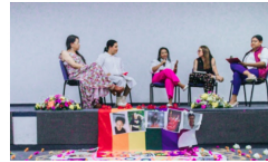
Éxito en conversatorio «Construyendo paz, sin discriminación»