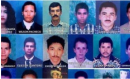
JEP adelanta audiencia pública en Barrancabermeja