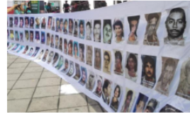
JEP realiza audiencia pública en Barrancabermeja en conmemoración del Día de las Víctimas