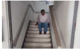
Denuncian que ascensor en Palacio de Justicia lleva seis meses sin funcionar