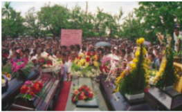
Conmemoran 26 años de la masacre del 16 de mayo de 1998 en Barrancabermeja